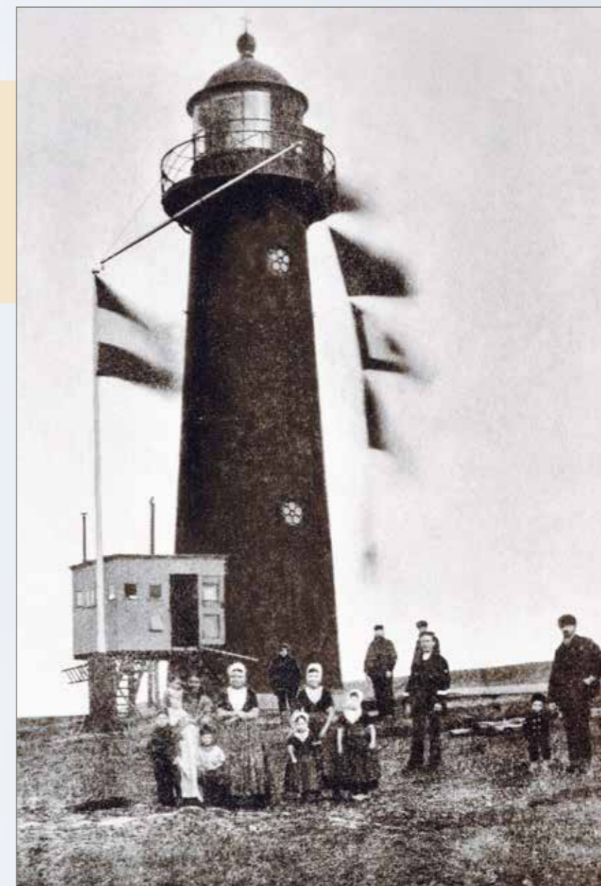
Op deze foto uit ± 1895 poseren de vrouw en kinderen van vuurtorenwachter Simon Waterman. Zoon Bram (links) werd later zelf ook vuurtorenwachter.

Kustwachtgebouwtjes kwamen en gingen, maar de toren zelf is nog zo origineel als wat, vertelt Willem. 'Dit was in 1876 de eerste ronde gietijzere vuurtoren van Nederland. De ontwerper – Quirinus Harder – wilde graag een ronde vorm om hem te onderscheiden van zijn hoekige overbuurman in Breskens.' De vorige lichtbron was een halogeenlamp van 250 watt. Sinds december 2024 brandt er onder de rode koepel een ledlamp met een bereik van ongeveer 24 kilometer. Dat licht vormt een zogeheten lichtenlijn met de grote vuurtoren van het dorp. Als schepen vanuit het noorden richting het Oostgat varen en beide lichten boven elkaar staan, dan liggen de schepen op koers. Het torentje is dus nog altijd functioneel. Al is het maar als baken van trots. Willem: 'Zeg nou zelf, twee van zulke vuurtorens in één dorp, dat is toch iets bijzonders? Door deze monumenten open te stellen, draagt het Polderhuis onze cultuur uit. Daar doe ik graag aan mee.'