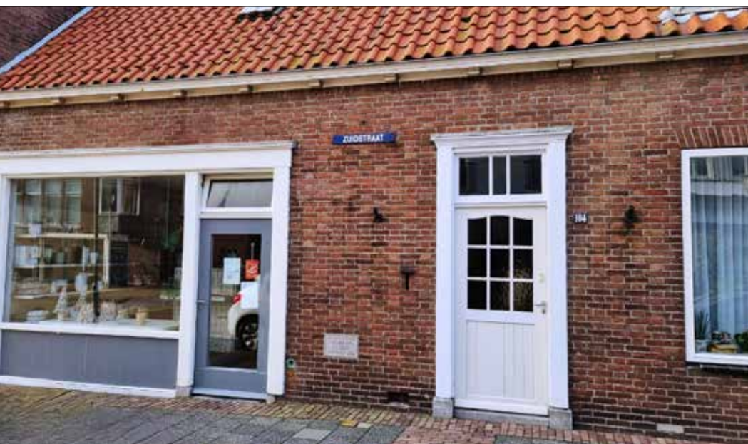
Hier was de ingang van de oude Kloosterstraat