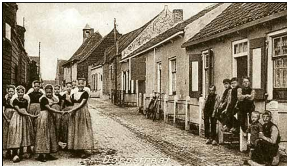
Kloosterstraat vanuit het zuiden, 1934