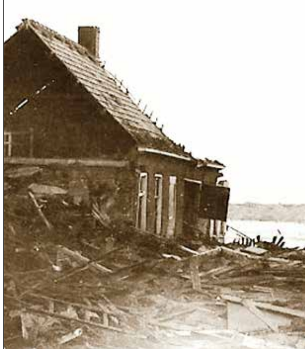
Verwoestingen aan de Kloosterstraat, met op de achtergrond de stroomgeul achter het dijkgat; 1945