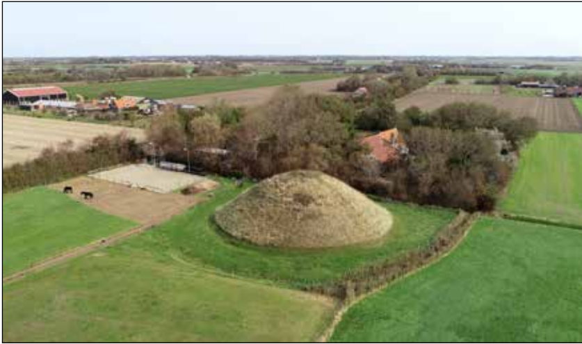
Boudewijnskerke, gekrompen dorp met vliedberg

16 november om 19.30 uur in het Polderhuis.