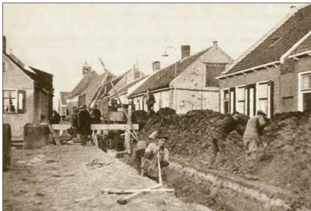
Aanleg riolering in de Kloosterstraat; 1938