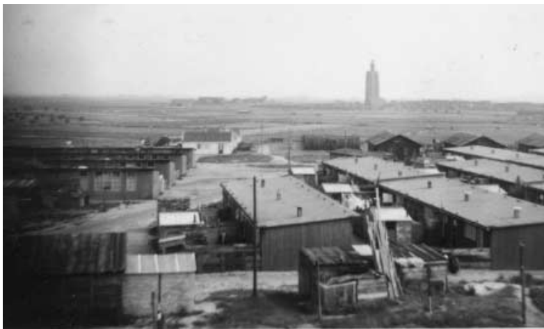
De noodwoningewijk op het Noordervroon

De noodwoningen op 't vroon, dat was wel een aparte wereld. Dwars door die wereld liep, als "mainstreet" in Disneyworld, breed en majestueus onze "hoofdstraete". Als het enige baken dat niet is verzet ligt de brandblusput van de hoofdstraete nu nog in het fietspad onder aan de dijk.