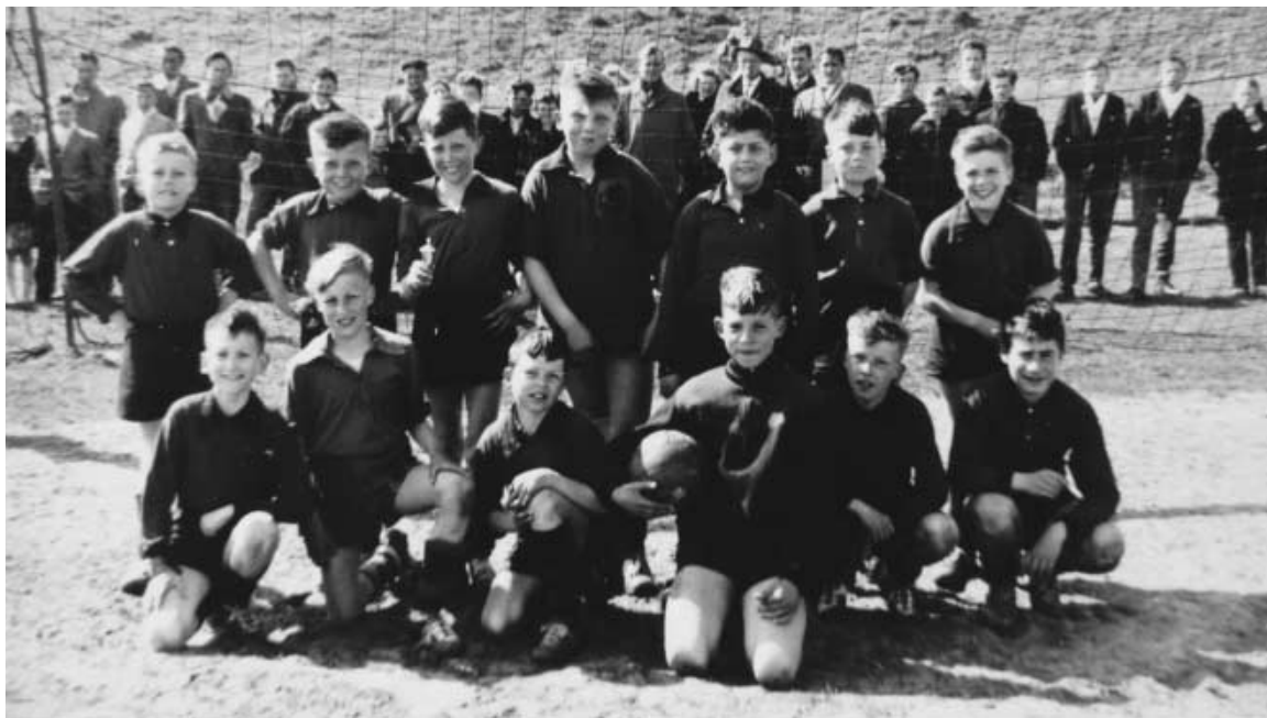
De Junior Noormannen in 1959

ziet. En om een schapendrolletje meer of minder maalde je niet.