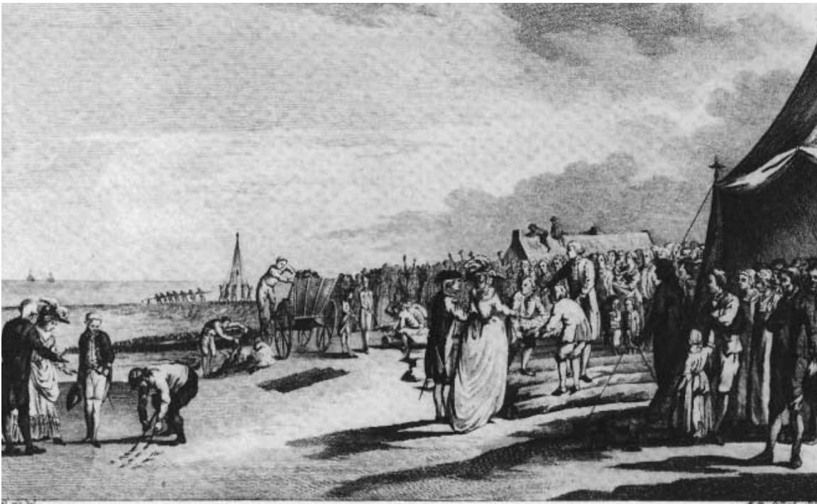
Het Bezichtigen van den Westcappelfchen Dijk, met derzelver bewerkingen, door zijne Doorl. Hoogh. WILLEM DE V. en deszelfs Koningl. Gemalinne en Vorstelijke Spruiten. Den 1 ste Julij, 1786.