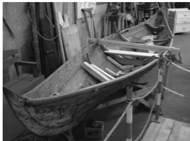
Momenteel wordt de boot gerestaureerd in de Oosterscheldewerf in Goes

In 2004 haalde Stichting Karolingische Burg Oost-Souburg een Vikingschip naar Zeeland. Het schip is een replica van de bijboot van het grote Gokstadschip en heeft eerder dienst gedaan in het themapark Archeon. De boot heeft de naam Aasa gekregen en is daarmee vernoemd naar een Deense Vikingkoningin. De boot wordt nu gerestaureerd door mensen van de Stichting Oosterscheldewerf in Goes. Dit reïntegratiebedrijf begeleidt langdurig werklozen naar werk en ze zijn blij met dit bijzondere bootje. De Aasa komt op 10 juni naar het Polderhuis. Hier maken we een feestdag van.