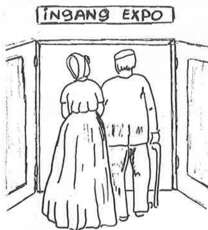
Zou me is ge kieke?